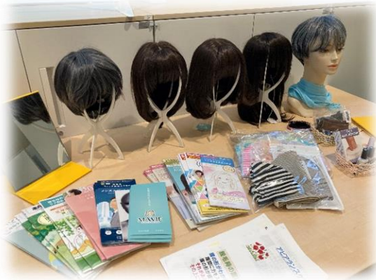
ウィッグ、ケア帽子の 情報あります！