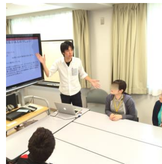
プログラムの様子

精神科の病気の症状は、日々の生活の様々な場面で生じるストレスと密接に関連しています。そのため、「自分にはどんなことがストレスで、その時にどんな考え方をしがちで苦しむことが多いのか」を患者さん自身が理解できること、症状に対処できるようになることが大切です。今回のように臨床現場でプログラムの効果を検証する研究を行うことで「どんな形で学習できるとより理解しやすいのか、より楽しみながら学習できるのか」を模索することにつながっています。