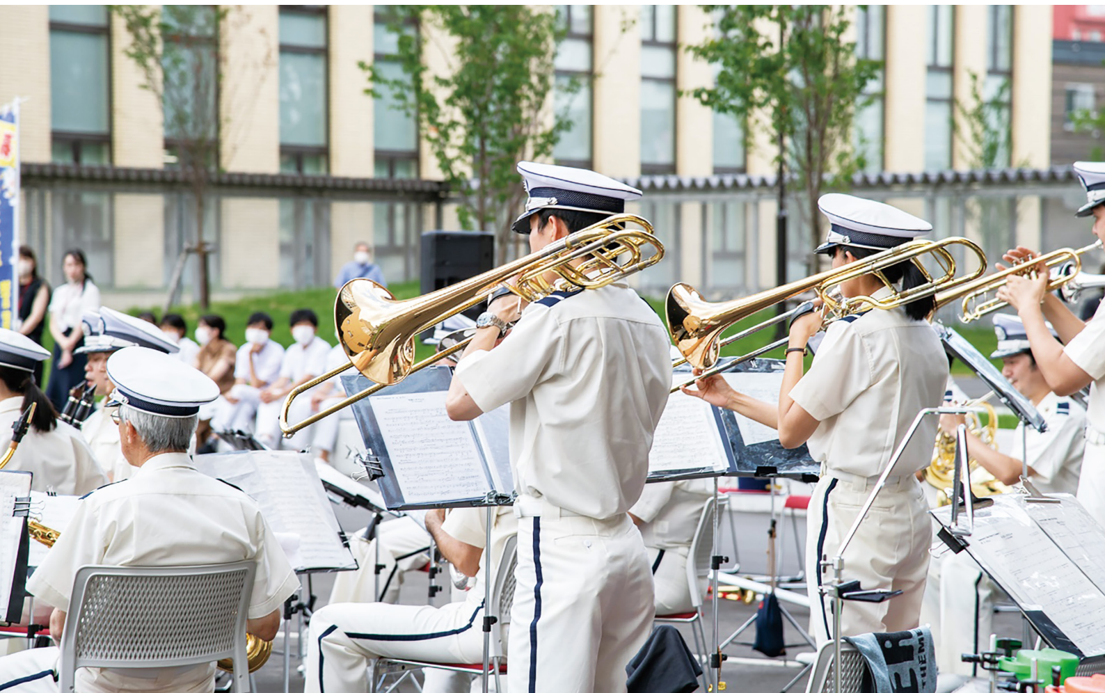
<2023年8月1日 北海道警察音楽隊演奏会 in 札幌医科大学附属病院>