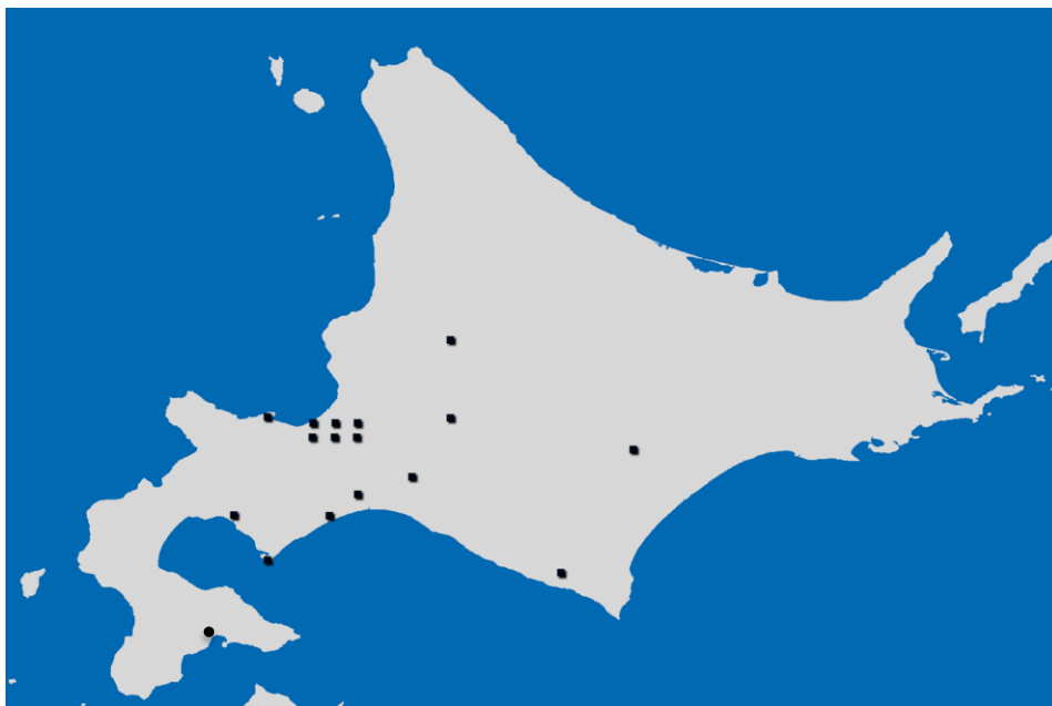
札幌医科大学眼科関連施設の分布図 (●関連施設)